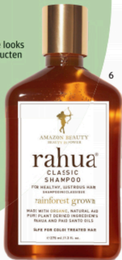
AMAZON BEAUTY BEAUTY IS POWER rahua® CLASSIC SHAMPOO FOR HEALTHY, LUSTROUS HAIR SHAMPOING CLASSIQUE rainforest growa MADE WITH ORGANIC, NATURAL AND PURE PLANT DERIVED INGREDIENTS RAHUA AND PAID SANTO OILS SAFE FOR COLOR TREATED HAIR 1120 ml / 11.2 fl. oz.