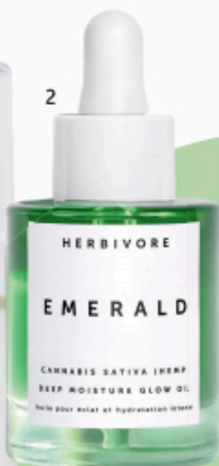
HERBIVORE EMERALD CANNABIS SATIVA (HEMP) DEEP MOISTURE GLOW OIL Huile pour éclat et hydratation intense