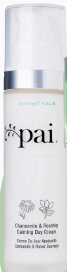
Chamomile & Rosehip Calming Day Cream Crème De Jour Apaisante Camomille & Rosier Sauvage