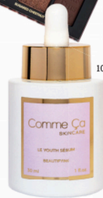
Comme Ça SKINCARE LE YOUTH SÉRUM BEAUTIFUL 30 ml 1.0 fl. oz.