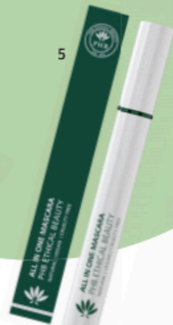
ALL IN ONE MASCARA PURE ETHICAL BEAUTY