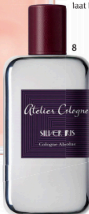
Atelier Cologne SILVER IRIS Cologne Absolue